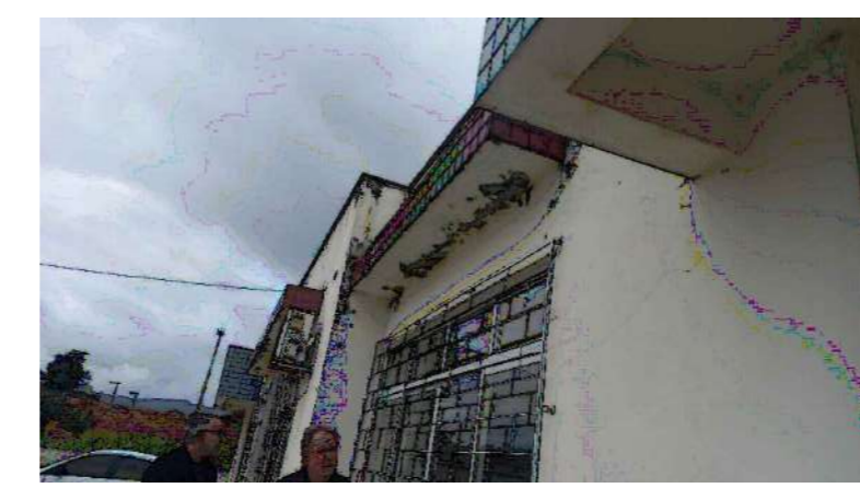
PATOLOGIAS EXTERNAS VISTA - NORTE