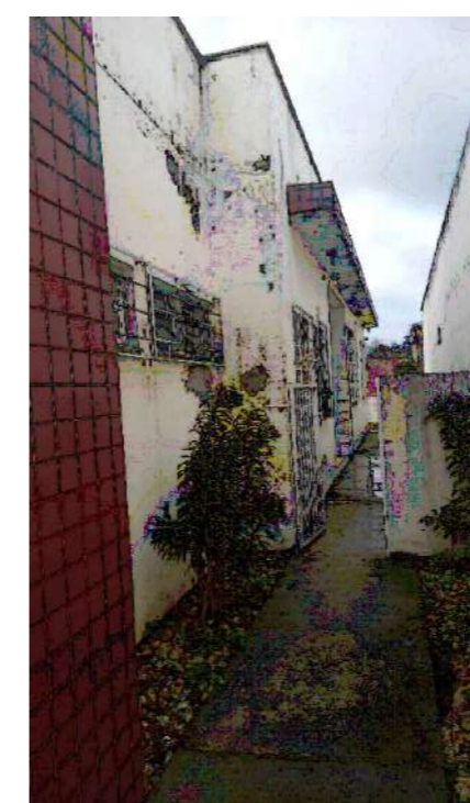
PATOLOGIAS EXTERNAS VISTA - SUL