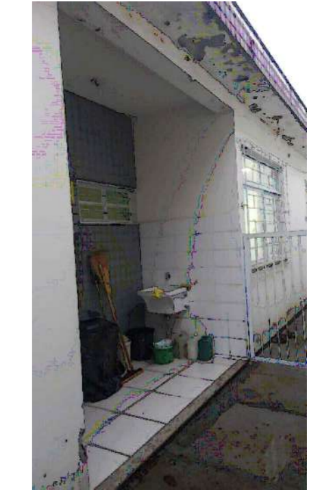
PATOLOGIAS EXTERNAS VISTA - SUL